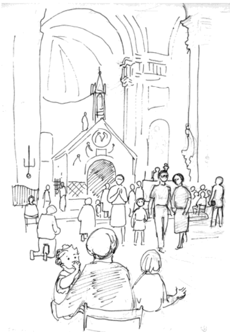
Portiuncula - tegnet af Erik Strid

Om Assisi-Kredsen som sådan er nødvendig som menighed? Hvis vi mener, den har en tjeneste at gøre for kirkerne og for verden, så ja!