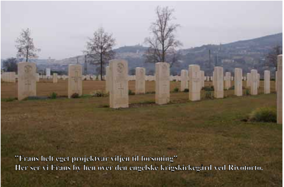
”Frans helt eget projekt var viljen til forsoning” Her ser vi Frans by hen over den engelske krigskirkegård ved Rivotorto.

vælger utvivlsomt selvhadet og askesen – men vi må vel have lov til at være klo- gere end ham... Han er offer for en tanke- mæssig konflikt, han næppe forstår, lige så lidt som han forstår konflikten mellem sin forelskelse i fru fattigdom, og den kirke, han bekender sig til. Og den beken- der sig absolut ikke til fattigdom.