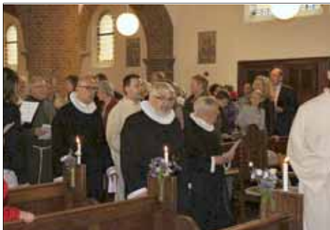
Assisi-Kredsens bestyrelse var også repræsenteret ved messen og afskedsfesten for franciskanerne i Roskilde.

rigtig glad for det, og det er blevet mere end bare en mellemstation. For som han selv bemærker, har han boet længere tid i Roskilde end noget andet sted i verden. For han flyttede hjemmefra som 17-årig og har nu boet i byen i 18 år.